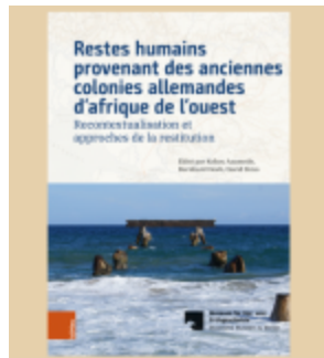
Cover: Böhlau Verlag

Museen der öffentlichen Hand in Deutschland stehen in einem Spannungsfeld zwischen gesellschaftlichem Auftrag und begrenzten Ressourcen, weshalb Organisationsentwicklung zunehmend an Bedeutung gewinnt. Die Studie untersucht anhand von Expert*inneninterviews Bedarfe, Ressourcen, Erfahrungen und Wirksamkeit professioneller Organisationsentwicklung in öffentlichen Museen. Die Auswertung zeigt, dass der Bedarf an begleiteter Organisationsentwicklung die bisherigen Erfahrungen deutlich übersteigt. mehr