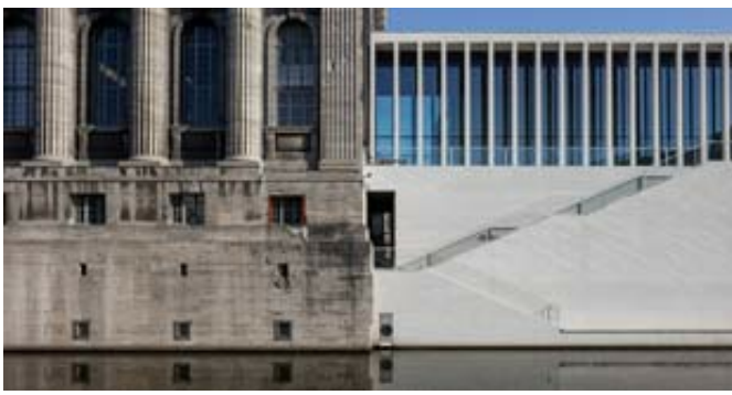
© Ute Zscharnt für / for David Chipperfield Architects